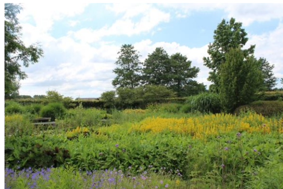
Impressie van een van de tuinen op het stadslandgoed.