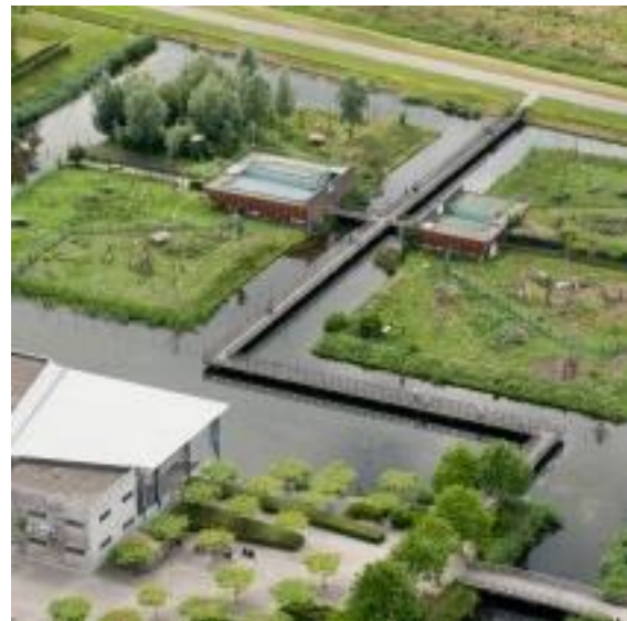
Apeneilanden van de Stichting AAP Almere.