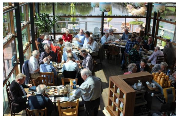
Lunch in Restaurant Dubbel-op.