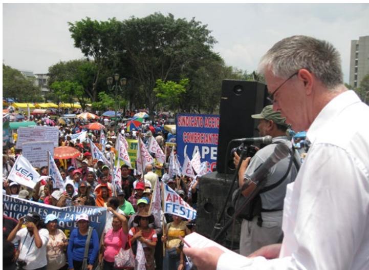
Toespreken coöperatie straatverkopers op kantoor CGTG in Guatemala-ciudad

en ook op andere plekken. De structurerende werking van de zuilen is verdwenen en daar is weinig voor in de plaats gekomen. Sociale structuren en vaak ook religieuze structuren blijken belangrijk om zo een moeilijke periode door te komen.