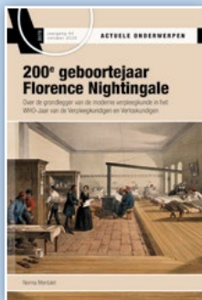
A0 3078 200° geboortjaar Florence Nightingale