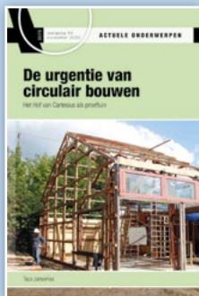
A0 3079 De urgentie van circulair bouwen