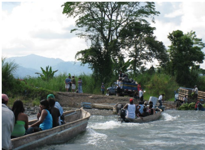
Openbaar vervoer naar Bajo Coen over de rivier de Sixalola, op weg naar de Bribri indianen.

De Bribri hebben een geheel eigen religie, cultuur en taal ontwikkeld en een samenleving die hun in staat stelt goed te leven in het oerwoud. Hun waarden en normen intrigeren mij en laten ook zien dat cultuur, religie, maar vooral ook geografie en historie van invloed zijn op een samenleving zoals die is. De Bribri geloven dat het leven geen individueel eigendom kan zijn. Je mag het leven een poosje gebruiken. Gebruiken totdat jouw beurt voorbij is, dan is het aan een ander om het voort te zetten. Leven is een levenslijn, een kralensnoer zo u wilt, langs vele generaties.