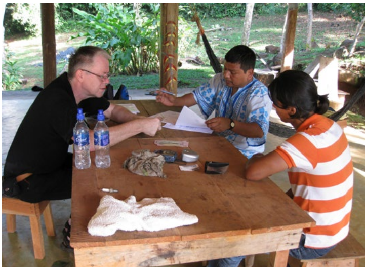
Overhandigen projectgeld aan Terraba-indiaan in Costa Rica, financiering ontmoetingsruimte kleinschalig toeristisch project.

culturele en milieuprojecten. Door middel van een nieuwsbrief en een vaste schare aan donoren, ook erfenissen, realiseren we veelal kleinschalige projecten waarmee de bevolking verder wordt geholpen.