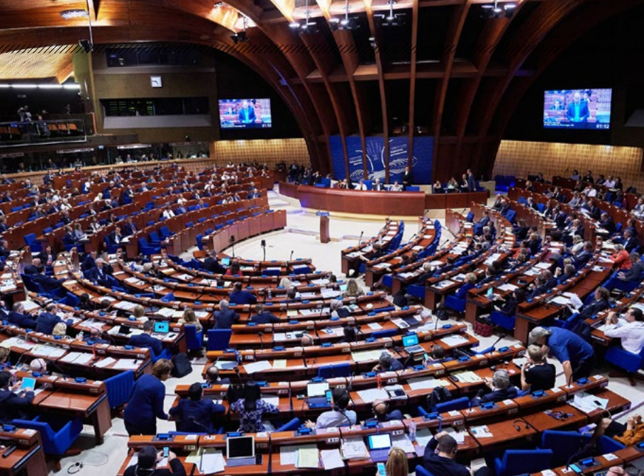
De Raad van Europa zetelt in Brussel

onderzocht of het desbetreffende land zich aan het charter houdt, waar dat niet het geval is en welke actie nodig is om dat beter te krijgen. Belangrijk daarbij is dat de rapporten niet veroordelend zijn, maar dat ze, zo mogelijk, met opbouwende kritiek en suggesties de relevante onderwerpen aan de orde stellen. Alle rapporten worden geagendeerd in een halfjaarlijks overleg van alle 47 ministers van Buitenlandse Zaken van de deelnemende landen.