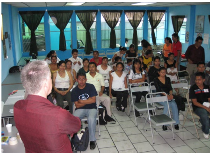
Toespraak 1 mei demonstratie arbeidersbeweging CGTG op plaza Central, Ciudad Guatemala

Als overheid spreken wij wel over ‘opinion public’, een mening gebaseerd op feiten, en ‘opinion populair’, de ongefilterde reacties.