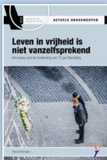
A0 3076 Leven in vrijheid is niet vanzelfsprekend

Kijk op onze website voor abonnementen en losse uitgaven: www.actueleonderwerpen.nl