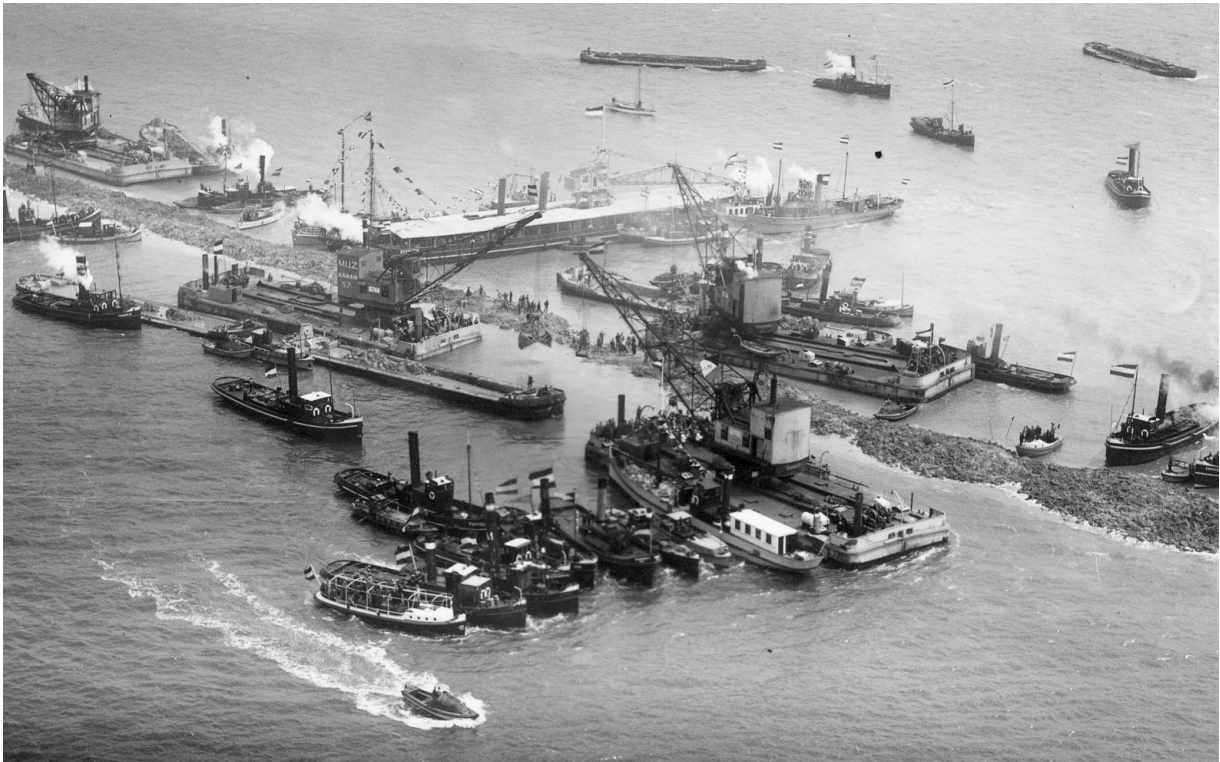
Drukte rond het laatste sluitgat op 28 mei 1932.

het oog op de ondergrond van de dijk, de stroomgeulen en de verwachte golfoploop langs de waterkering.