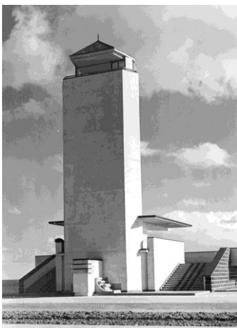
De noord- en noordwestzijde van Dudoks monument, 1933.

De dijk werd vanaf Wieringen en de Friese kust, en vanaf twee werkeilanden, Breezand en Kornwerderzand, in delen gebouwd. Om deze stukken met elkaar te verbinden moesten sluitgaten worden gedicht. Het laatste sluitgat was De Vlieter, dat op 28 mei 1932 werd volgestort. Nabij de plaats waar de dijk gesloten werd, verrees naar een ontwerp van architect Willem Marinus Dudok een uitkijktoren als herdenkingsmonument. Beeldhouwer Hildo Krop maakte voor dit monument een bronzen reliëf ter ere van de steenzetters, de arbeiders die onontbeerlijk waren voor een gedegen afwerking van een dijklichaam. Het kunstwerk is voorzien van het opschrift 'Een volk dat leeft, bouwt aan zijn toekomst'. Deze tekst was verzonnen door het MUZ-bestuur, dat het monument aanbood aan de Staat der Nederlanden ter gelegenheid van het in gebruik stellen van de weg over de dijk op 25 september 1933.